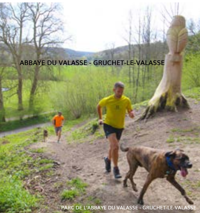
ABBAYE DU VALASSE - GRUCHET-LE-VALASSE