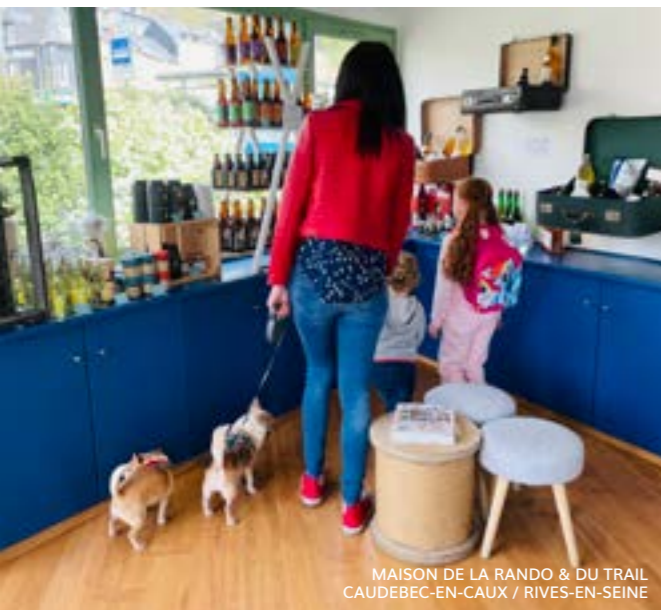
MAISON DE LA RANDO & DU TRAIL CAUDEBEC-EN-CAUX / RIVES-EN-SEINE