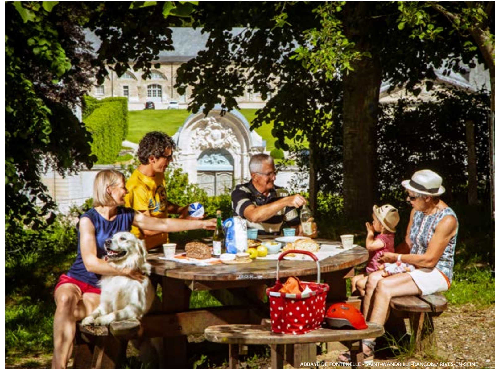
ABBAYE DE FONTENELLE - SAINT-WANDRILLE-RANÇON / RIVES-EN-SEINE

Créé en 2007 par l'Office de Tourisme de Troyes, ce label consiste à bien accueillir les propriétaires d'animaux dans les divers lieux visités pour un séjour en toute sérénité .