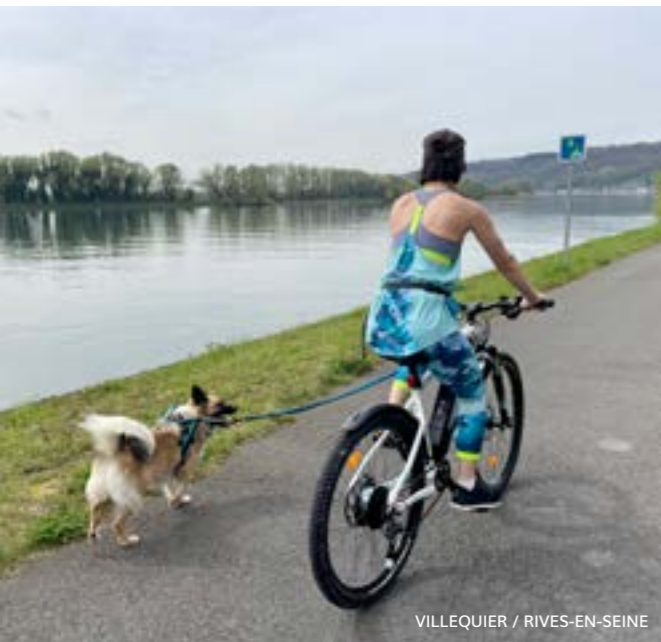
VILLEQUIER / RIVES-EN-SEINE