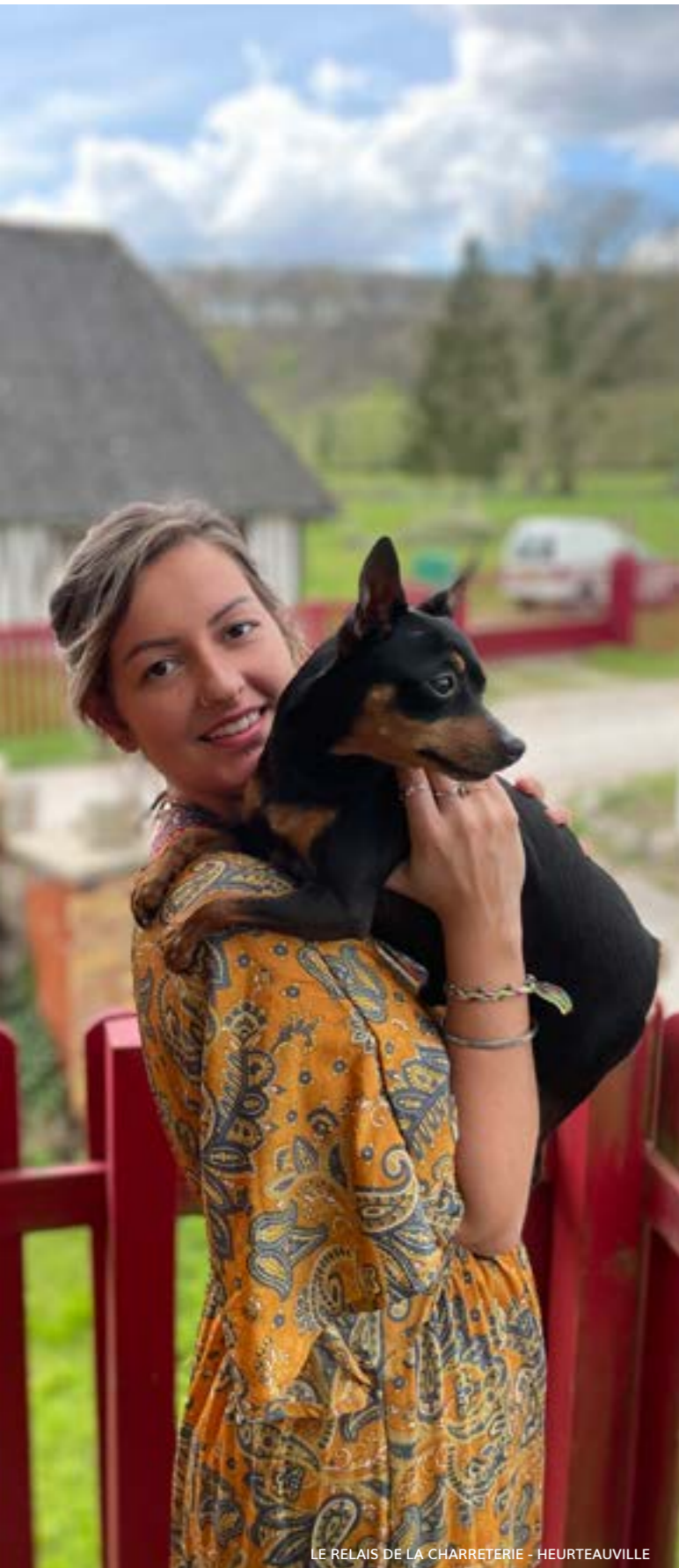
LE RELAIS DE LA CHARRETERIE - HEURTEAUVILLE

Vous êtes décidés, vos prochaines vacances ou votre prochain week-end avec votre animal, ce sera en Normandie , loin de la foule et si possible en lien direct avec la nature. Besoin d'inspiration, d'activités ou encore de sorties à faire en famille ou entre amis en bord de Seine et si possible pas trop loin de la mer et des plages normandes afin que vous puissiez vous détendre avec votre compagnon à quatre pattes.