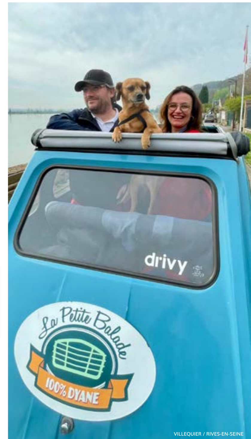
VILLEQUIER / RIVES-EN-SEINE